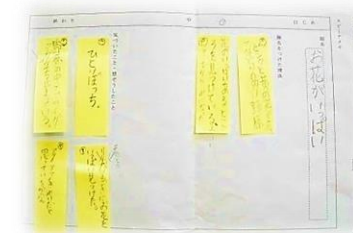
【付箋紙を用いたスピーチメモ】

6月24日(金)、4年生の国語の授業を全教職員に公開し、授業研究をおこないました。「写真から読みとったことや想像したことが伝わるようにスピーチをしたり、友だちのスピーチを聞いたりしよう」という課題のもと、「話すこと・聞くこと」に焦点化した授業を行いました。子どもたちはメモをもとに、写真から想像したことや、写真につけた題の理由をわかりやすく伝えようと発表に取り組んでいました。メモだけをベースにしたスピーチですが、一人一人の感性が感じられた素晴らしいものとなっていました。また、子どもたちの聞く態度もたいへん立派でした。